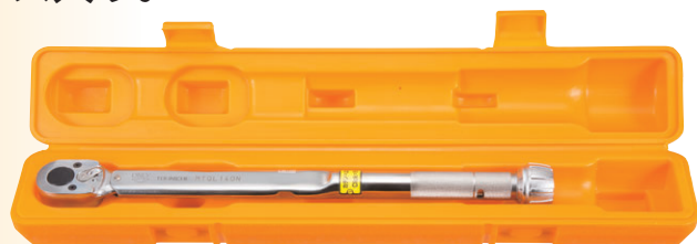
MTQL140N（ハードケース No.843 収納状態）