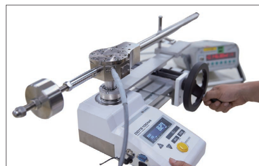
トルクレンチテスタ DOTE4 における JCSS 校正の例

*: 東日開発のトルク基準機と参照用トルクレンチにより、JCSS のトルク基準範囲外での、トレーサビリティを確立し、不確かさ校正証明書を添付した製品